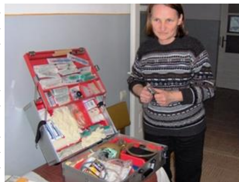
Hilfreicher Notfallkoffer für die Ärztin

Ein gut ausgestatteter Notfallkoffer, gespendet von einem Papagenomitglied, leistet einen sehr nützlichen Dienst bei den Arztbesuchen in den umliegenden Gemeinden.