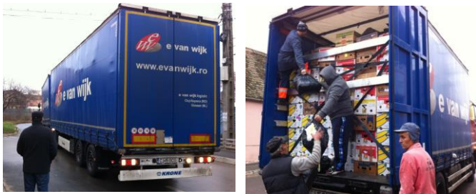
Voll beladene LKWs beim Abladen vor dem Dress-In (Verteilzentrum) in Sibiu / Rumänien

Papageno transportiert mit 6-7 LKWs pro Jahr über 100'000 Kleidungsstücke, med. Ausrüstung für Spitäler und Heime, Schulmobiliar, Betten, Decken usw. nach Rumänien. Dazu kommen unzählige Tonnen haltbare (nicht abgelaufene) Lebensmittel. Mit den letzten 10 Lastwagenfahrten haben wir Hilfsgüter im Gesamtgewicht von etwa 135 Tonnen von Murg am Walensee nach Sibiu/Hermannstadt in Rumänien transportiert.