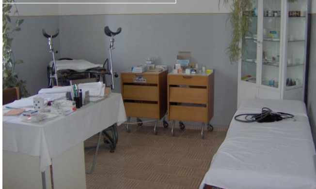
Eines der beiden Behandlungszimmer

Die Leitung des Gesundheitszentrums liegt nun schon viele Jahre in den Händen der Ärztin. Ihr ist es gelungen, einen einfachen Hauspflegedienst aufzubauen.